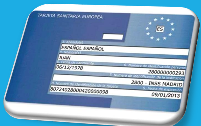
Tarjeta sanitaria europea (TSE)