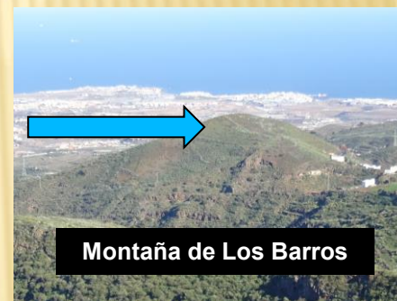
Montaña de Los Barros