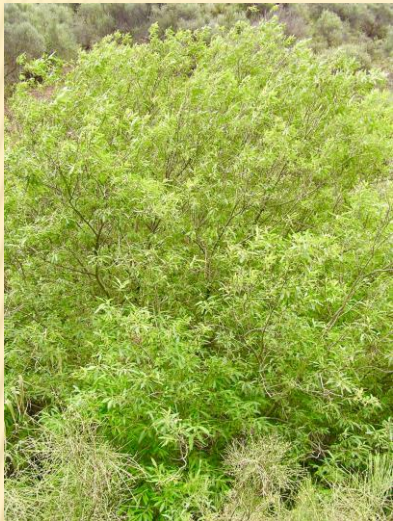
Sauces del Barranco de Los Cernicalos, bosque en galería