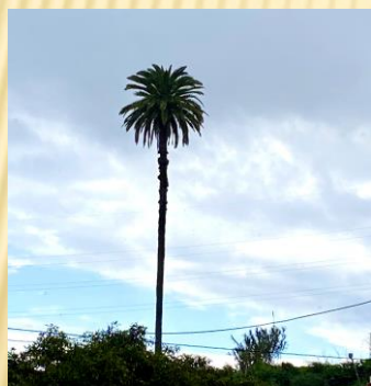
Palmera de Los Arenales de 29,4 metros de altura

https://www.telde.es/areas/playas-y-medioambiente/medioambiente/o-m-reguladora-de-los-arboles-singulares-de-la-ciudad/