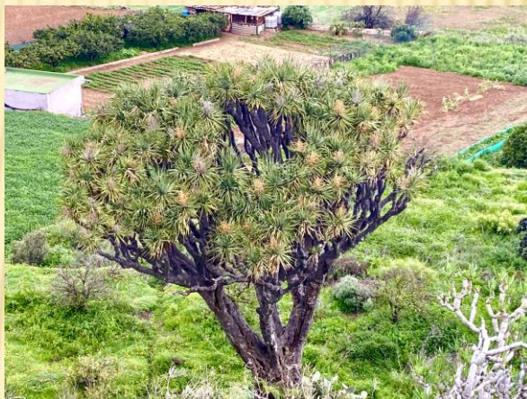
Drago de Los Arenales, 260 años