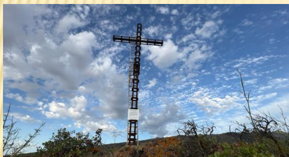
Cruz Anunciadora de las Fiestas de Ntra. Sra. de Las Nieves