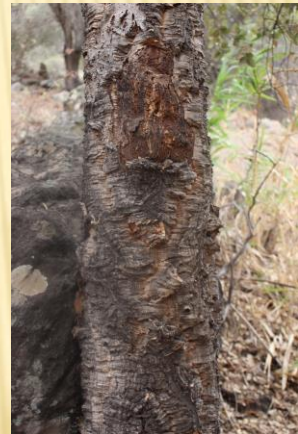
5 alcornoques de + 100 años