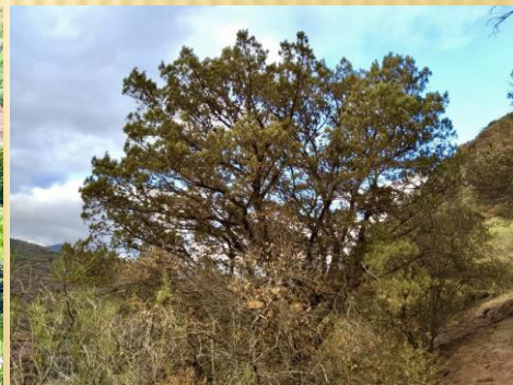
Sabina de Los Cernícalos, + 200 años